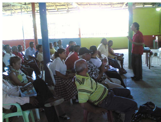
Foto 5. Capacitación Procedas, Praes y Cideas

Esta jornada se llevó a cabo la primera semana de mayo de la misma forma que se desarrolló la primera etapa e igualmente en los mismos municipios.