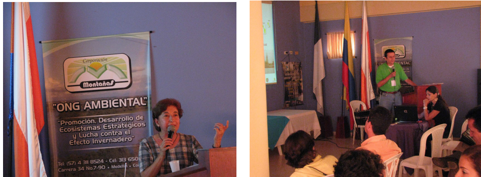
Foto 6. Foro Regional de Humedales, Coveñas-Sucre