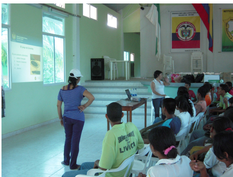
Foto 1. Municipio de Majagual-Sucre

Para esta jornada didáctica y lucrativa de educación ambiental, se presentaron resultados y material informativo de la región, los cuales están definidos y expuestos en el informe parcial realizado en el mes de agosto del presente año. (Ver anexos 1-8 de Informe Parcial, agosto 21 de 2008).